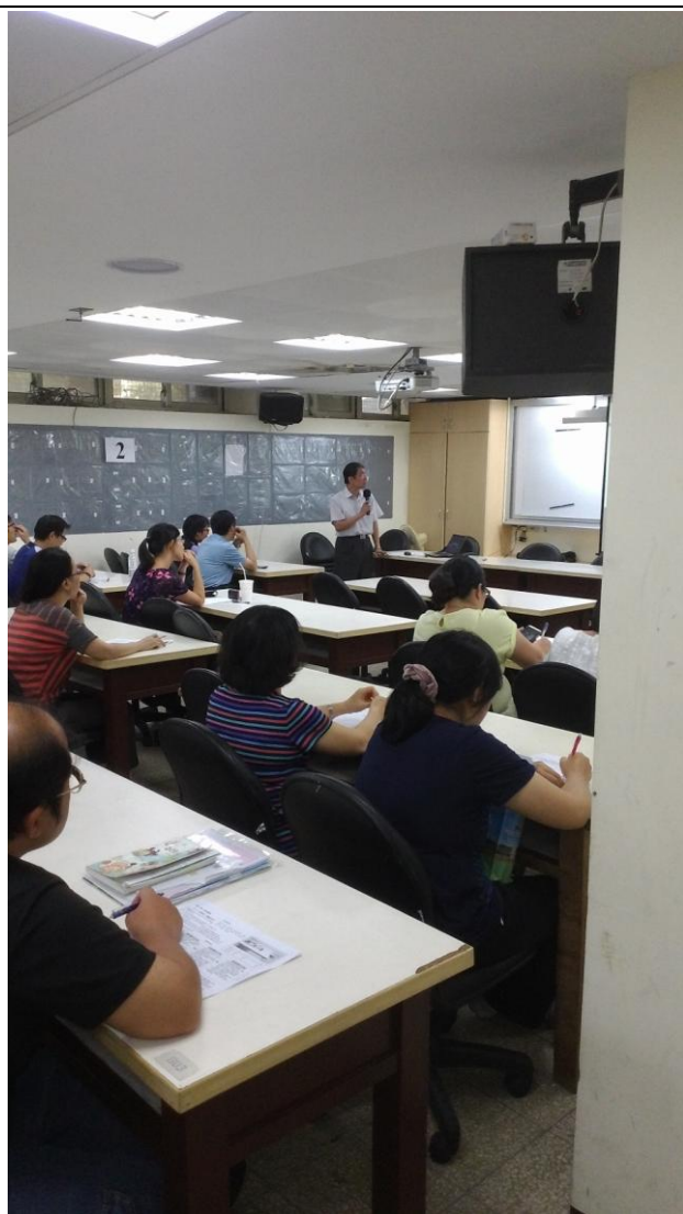
圖說：10/21 輔導團公開觀課→議課