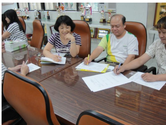
圖說：10/7 共同備課(II)---生活科技科