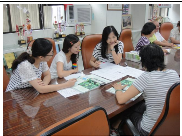
圖說：11/3 共同備課(III)---生物科