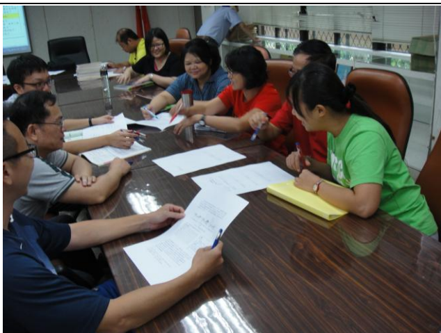
圖說：10/28 段考、會考試題分析(I)