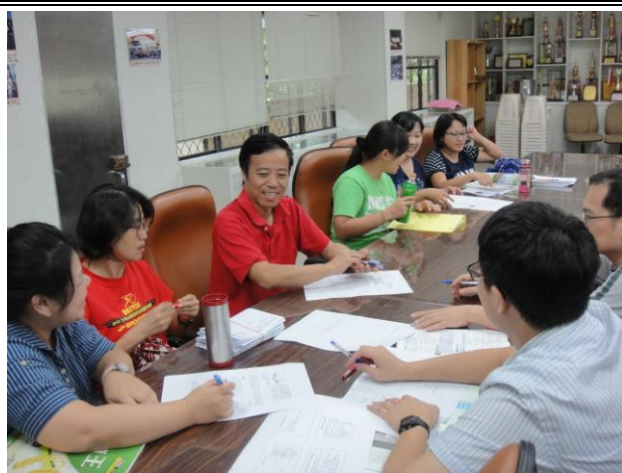
圖說：9/30 共同備課(I)---理化科