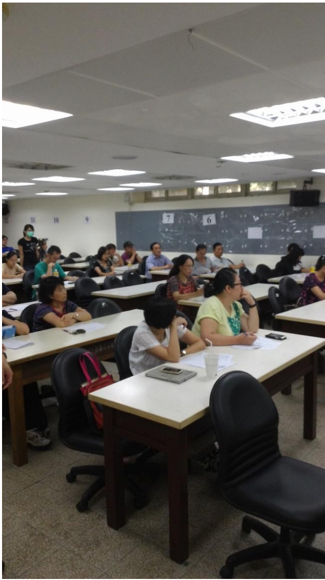
圖說：10/21 輔導團公開觀課→議課