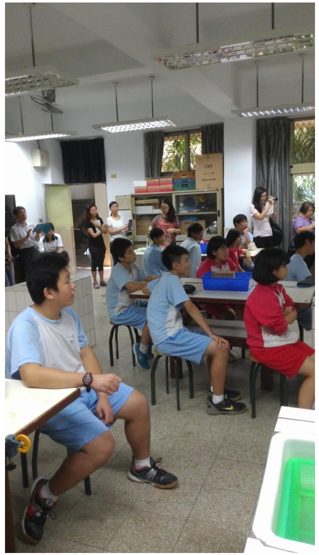
圖說：10/21 輔導團公開觀課→議課