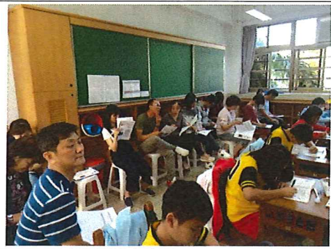
10/23 種子教師素養導向教學設計共備