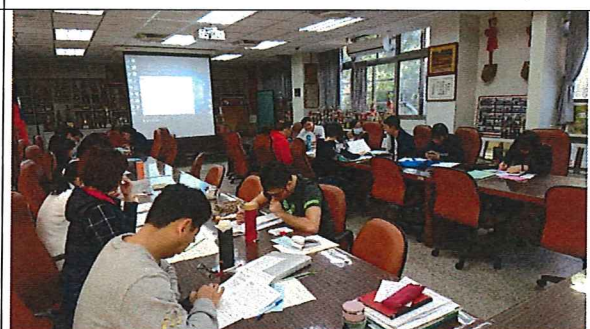
12/18 戶外教育與田野調查 研習講座