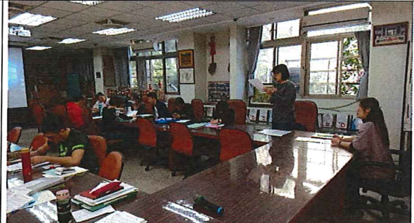
11/13 公開授課與議課：歷史科