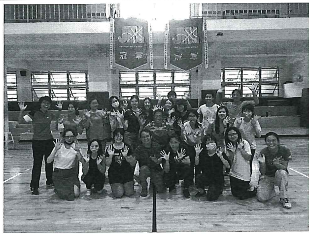
遊戲教學與應用研習