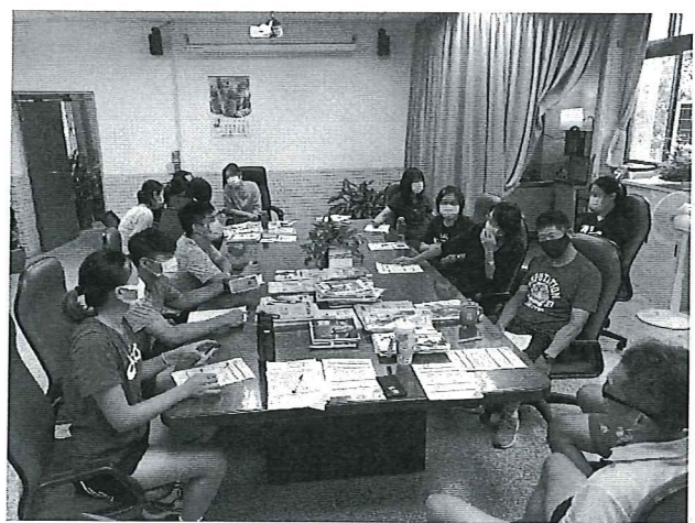
109 學年度書商說明會與選書會議