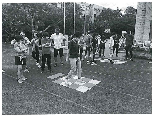
探索教育教學與應用研習