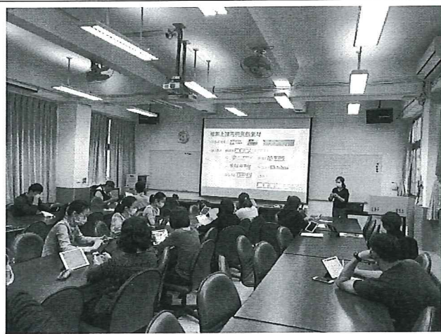
IPad 課堂實用技巧研習