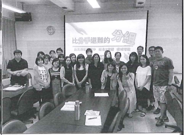
108/05/30 教學技巧增能研習