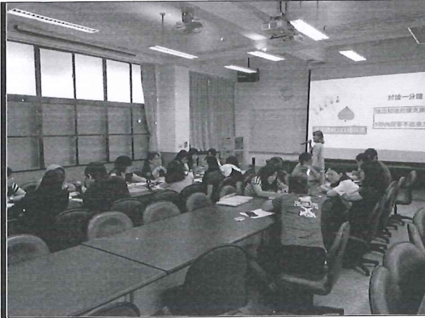
108/05/30 教學技巧增能研習