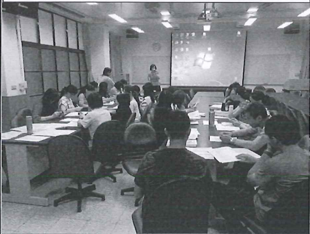
108/05/23 第三次教學研究會