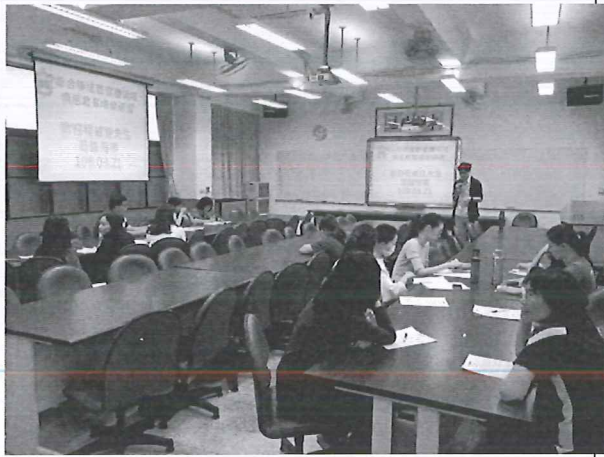
108/03/21 校內增能研習：童話心理學