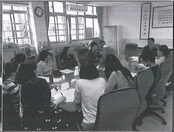
108/02/21 期初課程討論與規劃