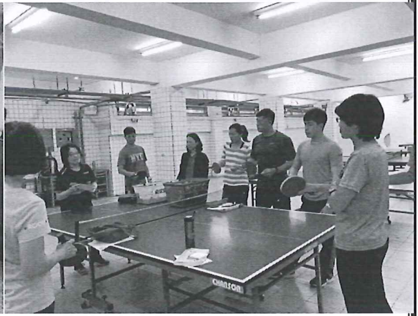
108/04/11 桌球裁判實務研討