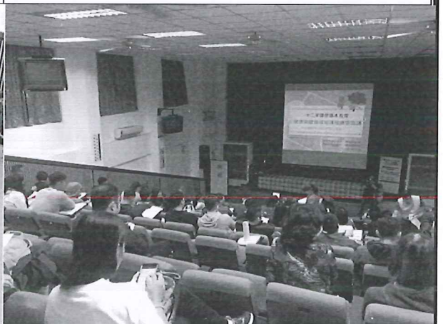
108/05/09 校外增能研習：領綱研習