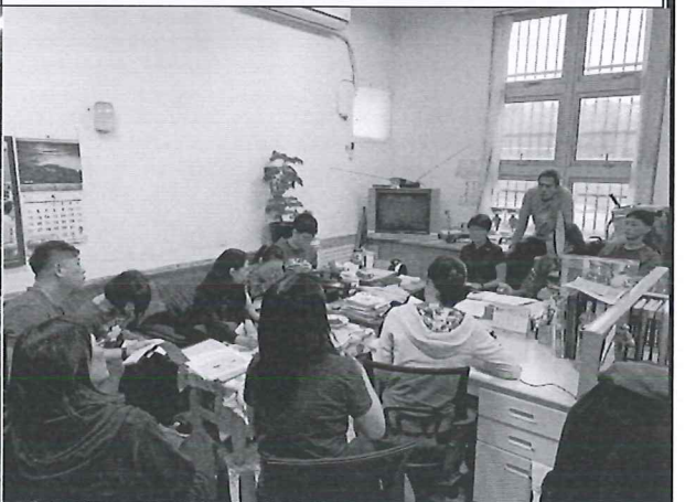
108/05/23 游泳活動實務說明及討論