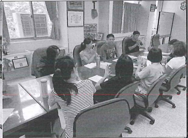
108/06/20 期末課程統論與展望