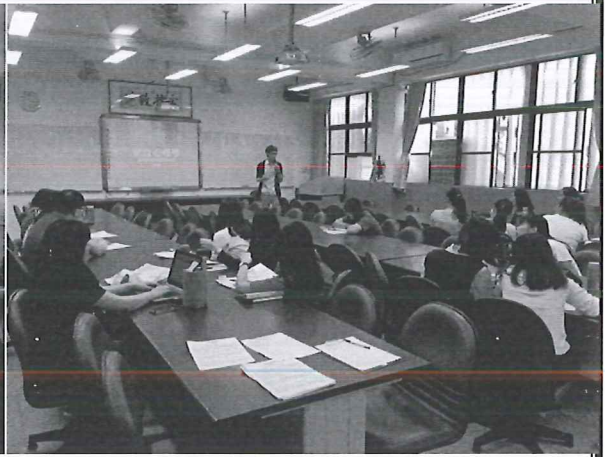
108/03/21 校內增能研習：童話心理學