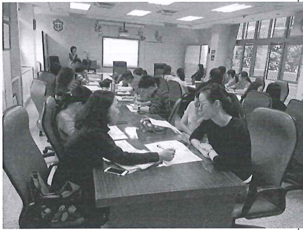
108/04/11 第二次教學研究會