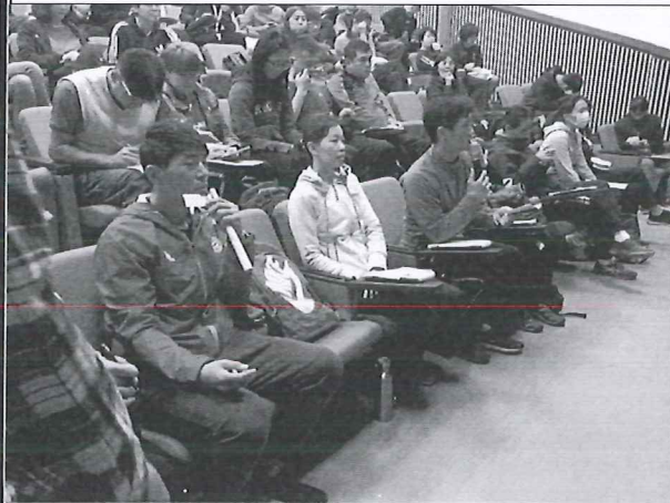
108/05/09 校外增能研習：領綱研習