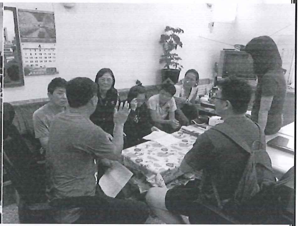
108/04/25 教學觀課反思回饋-議課