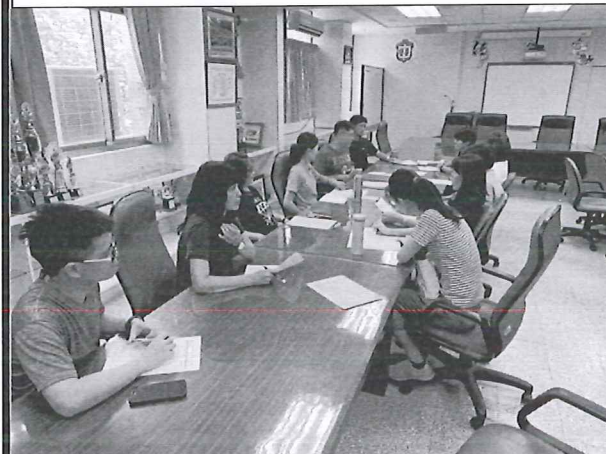
108/06/20 第四次教學研究會