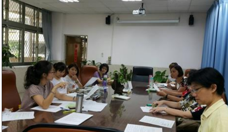
圖說：2017.05.23 擬訂 106 學年課程計畫。