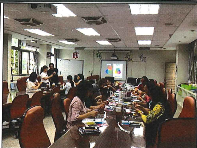
圖說：STEM 教具實作與應用