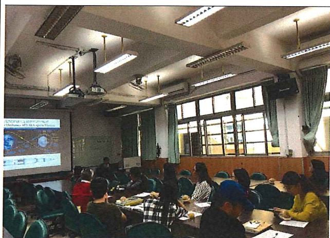
圖說：看電影學自然