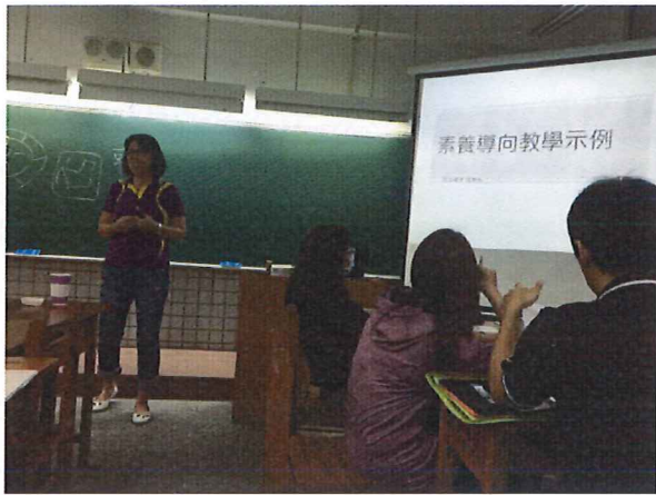
圖說：4/12 素養導向教學示例分享