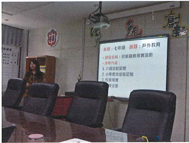
圖說：5/31 童軍科議題融入分享