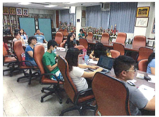
圖說：6/21 輔導科議題融入分享