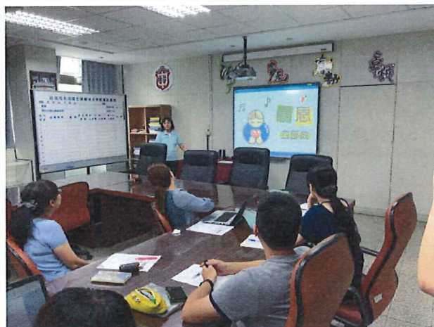
圖說：6/21 輔導科議題融入分享