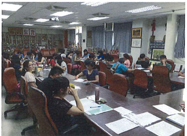
圖說：5/17 教師討論與交流