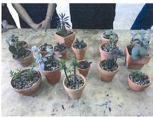
圖說：3/29 惇敘工商環境教育課程(多肉植物)