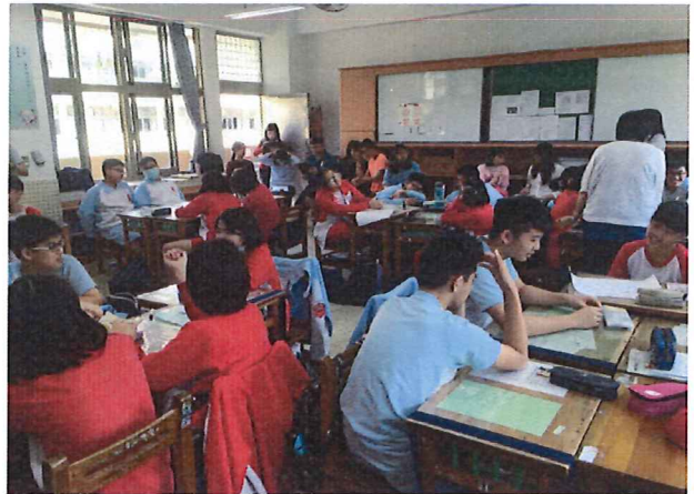
圖說：4/19 學生小組討論