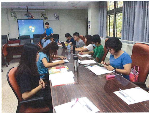
圖說：6/21 期末教學研究會議