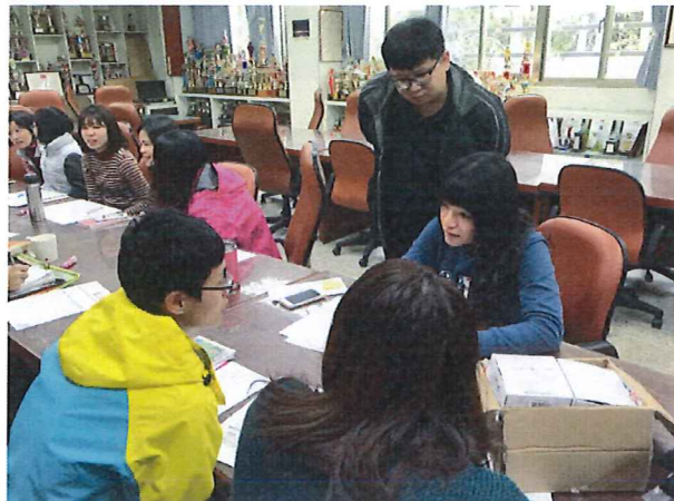
圖說：2/22 分科進行教學討論