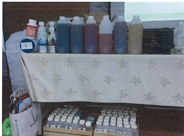
圖說：3/22 進行實作體驗課程