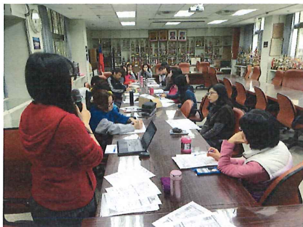
圖說：2/22 領域討論行事曆工作規劃