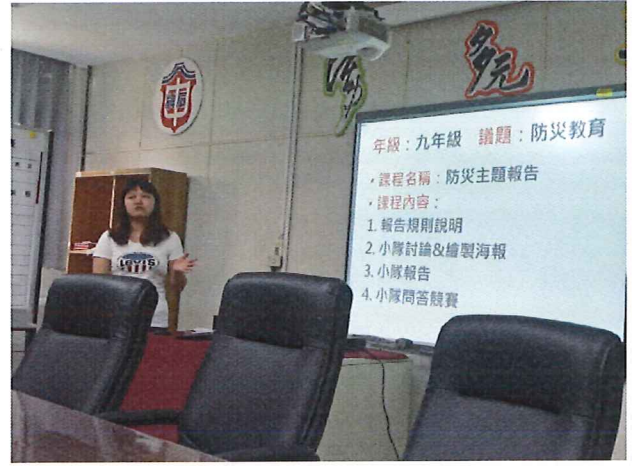
圖說：5/31 童軍科議題融入分享