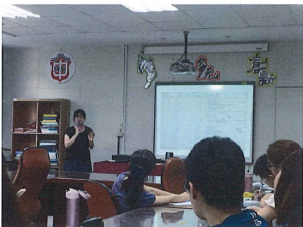
圖說：5/17 家政科議題融入分享