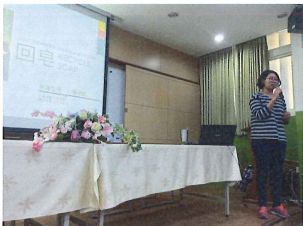
圖說：3/22 專業知能精進研習(手作我皂你)