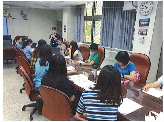
圖說：6/21 推選下一學年度領召與科召