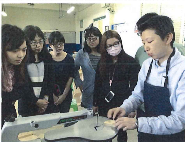
圖說：3/29 惇敘工商體驗木工課程