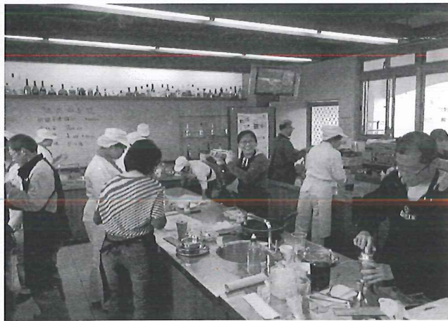
圖說：3/13 高職參訪：稻江護家_家政科