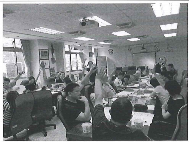
圖說：5/15 第二次定考試題分析