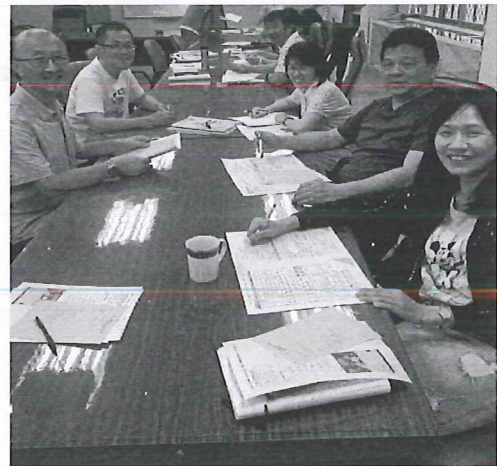
圖說：4/10 第一次定考考題分析討論