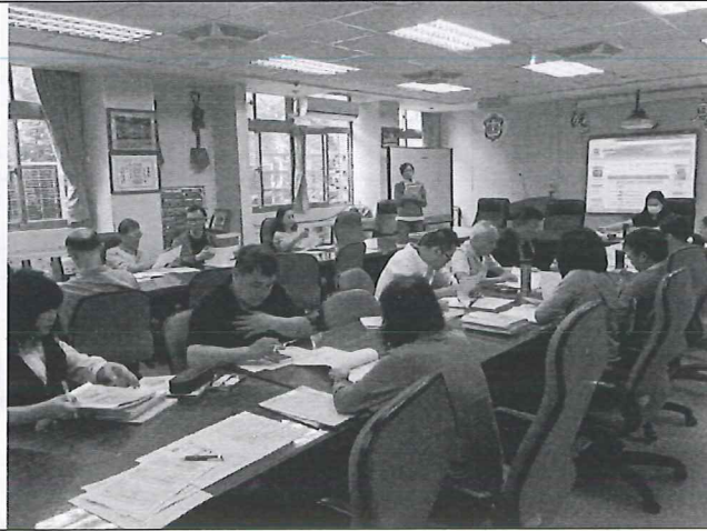
圖說：2/20 共同備課討論及學期工作分配