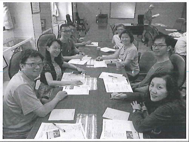
圖說：6/5 期末工作討論及下學期工作事項、 歡送退休老師