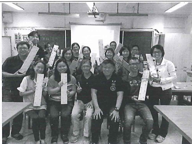
圖說：5/8 自造中心研習：STEAM 素養研習 (腋下好痛)