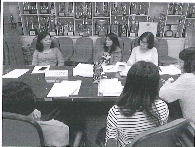
圖說：分組討論彈性課程教材內容。