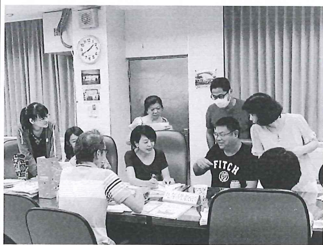
圖說：年級社群共同備課。