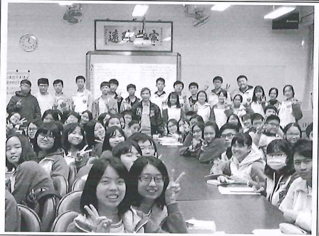
圖說：演說後和參與學生合影。