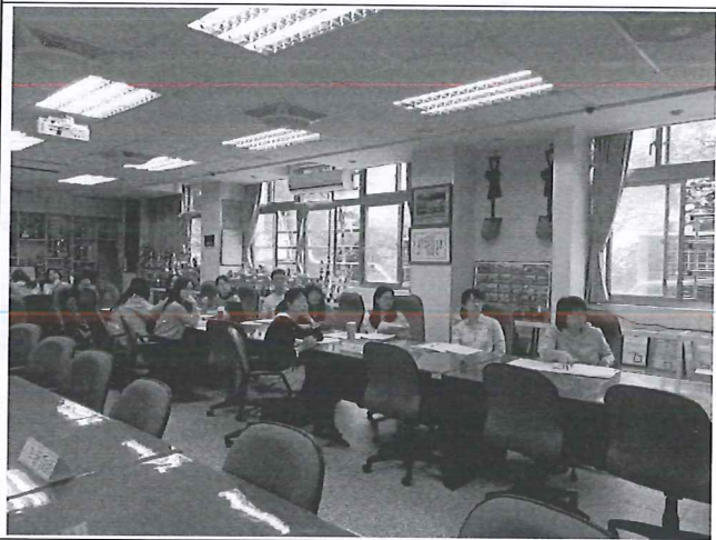
圖說：第一次教學研究會。