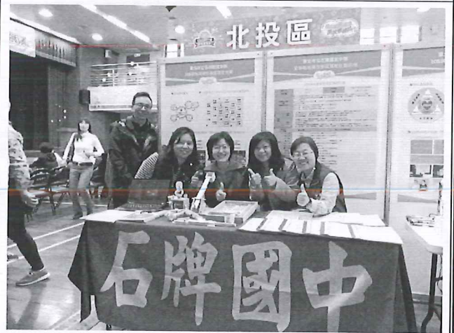
圖說：參加台北市彈性課程博覽會。