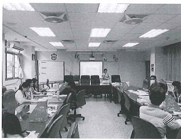
圖說：活閱課程各單元內容分享。