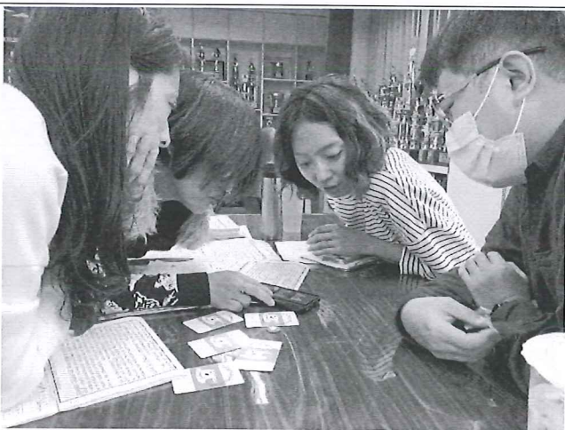
圖說：教學工作坊——桌遊應用與教學。