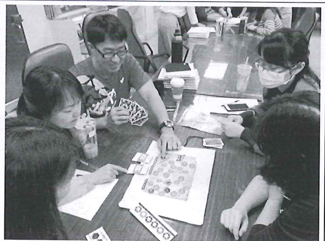
圖說：教學工作坊——桌遊應用與教學。