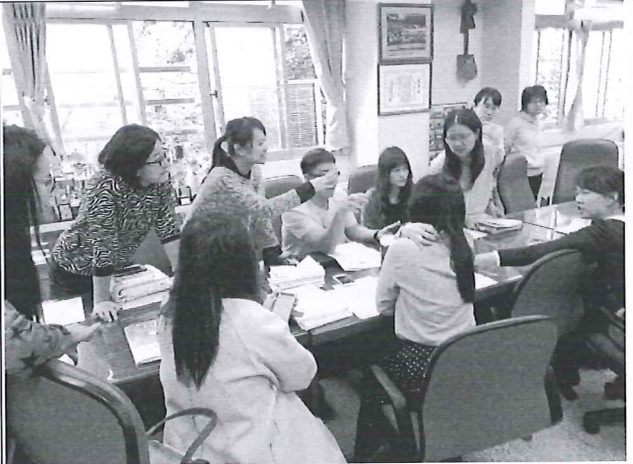
圖說：共同討論彈性課程教材內容。