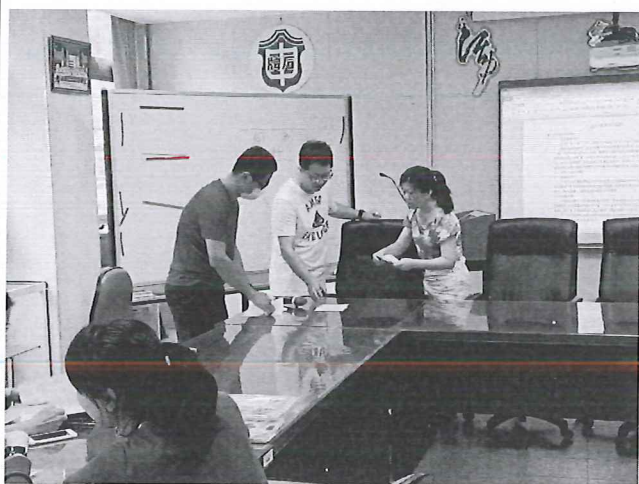
圖說：票選下學期教科書版本。