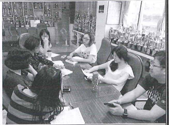
圖說：觀課前之共同備課。