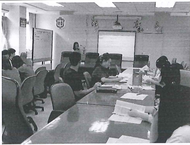
圖說：關於彈性課程之工作分配。