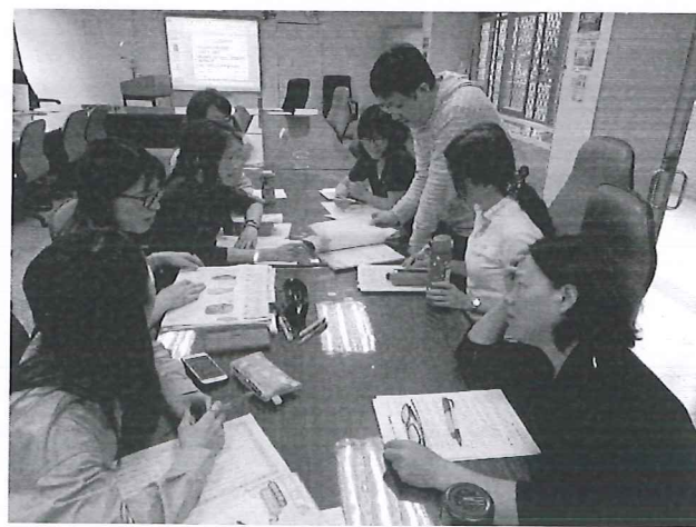
圖說：年級社群共同備課。