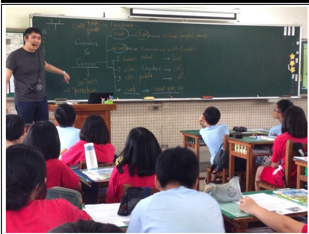
圖說：公開授課—課文心智圖