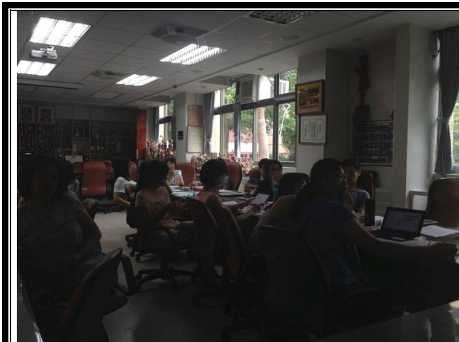
圖說：共同備課重點討論及學期工作分配