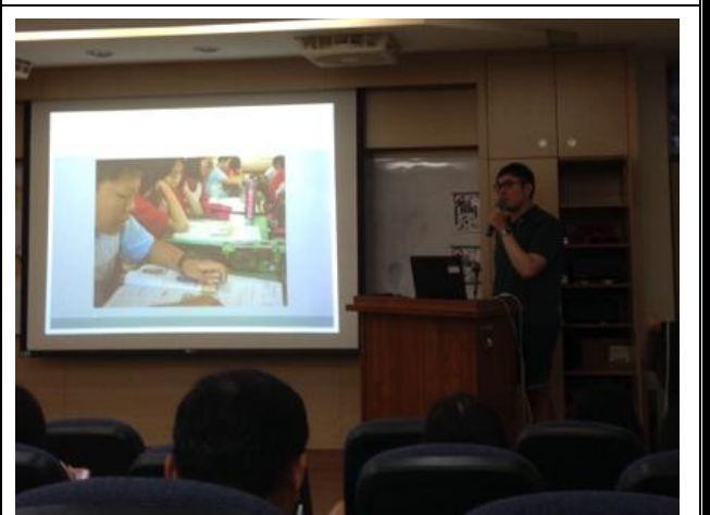
圖說：跨校共備分享（明德國中）