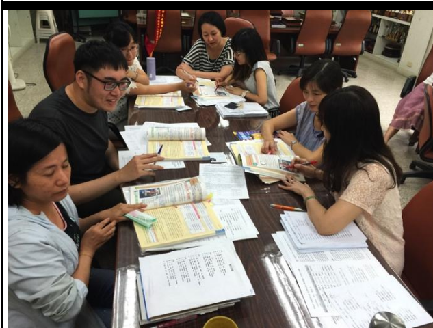
圖說：第一次共備分享--教案準備