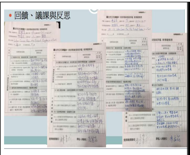
圖說：教學回饋 議課與反思