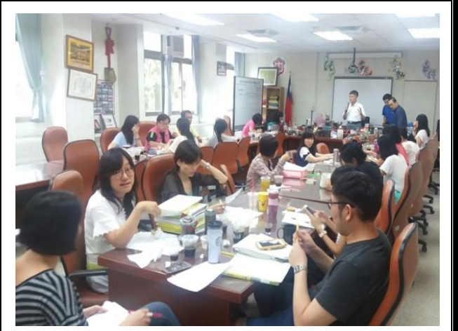
圖說：共同備課--多元文化研習