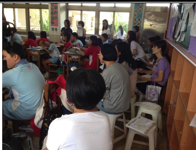
圖說：觀課與師生互動