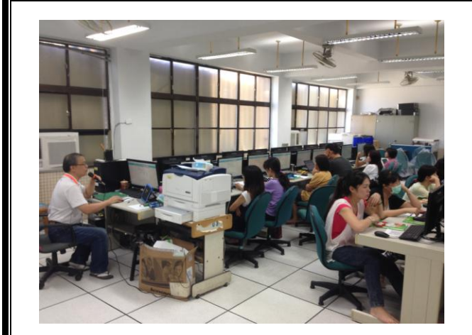
圖說：共同備課—資訊研習