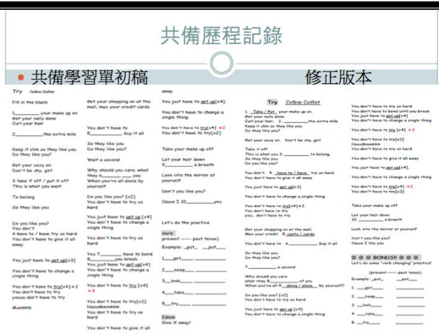
圖說：第二次共備分享—修正與討論