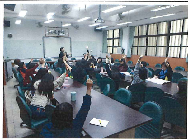
(五) 2018/05/07 明德國中：輔導團課綱導讀